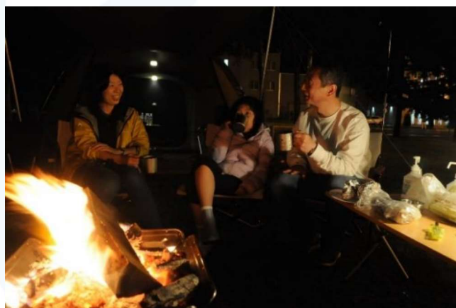
- 焚き火・BBQタイム -