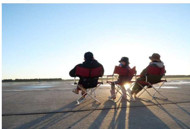
- 駐機場での贅沢コーヒータイム -