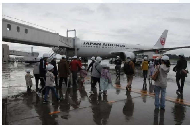
- 航空機見学 -