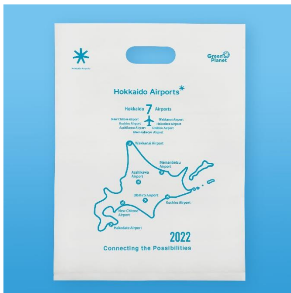
(ショッピングバッグイメージ)