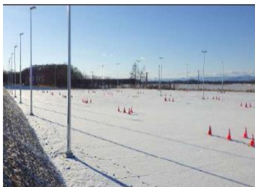
拡張後の臨時駐車場